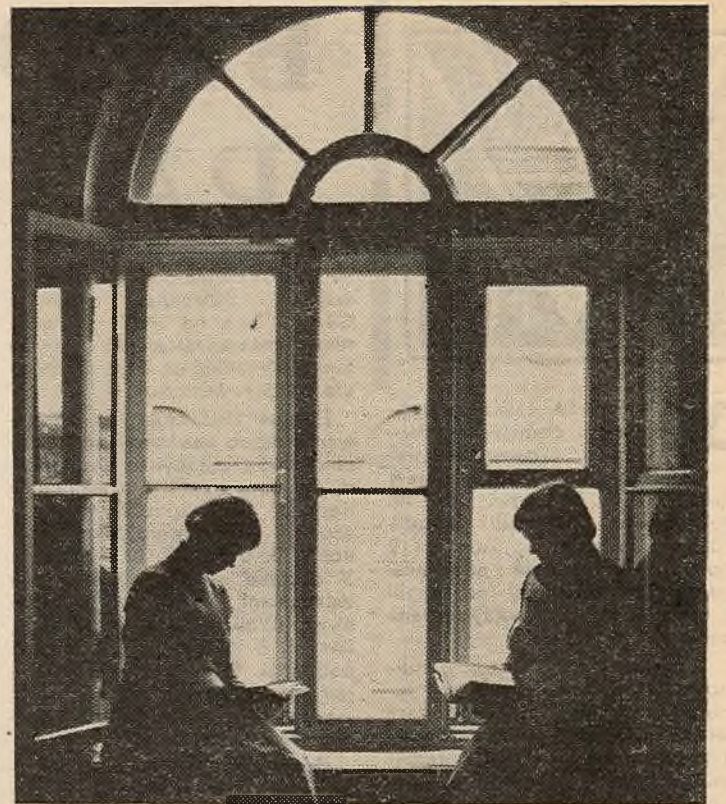
Вясна, канспект і сонейка...

В. САЎЧУК, старшыня студсавета інтэрната № 2.