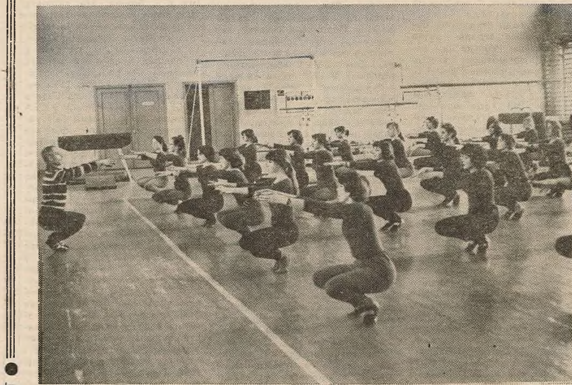
У гімнастычнай зале БДУ імя У. І. Леніна.